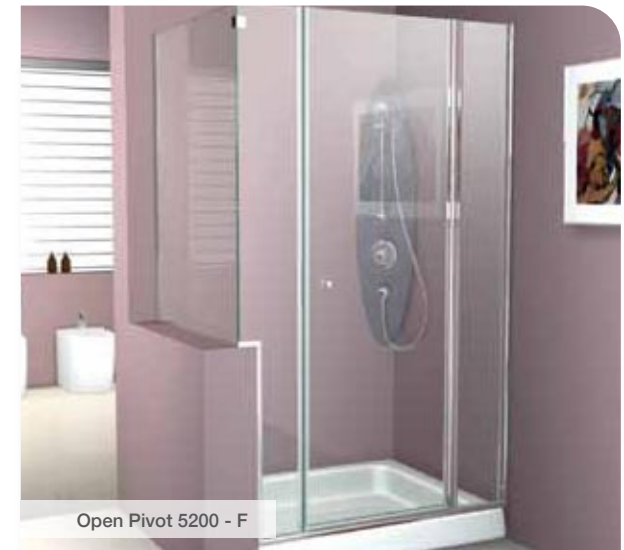
Open Pivot 5200 - F

5400-C Base: 700 x 700 a 1200 x 1200 mm Altura: 1850 mm