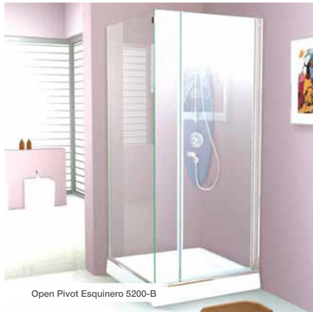
Open Pivot Esquinero 5200-B