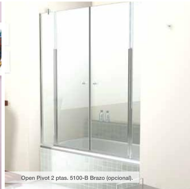
Open Pivot 2 ptas. 5100-B Brazo (opcional).