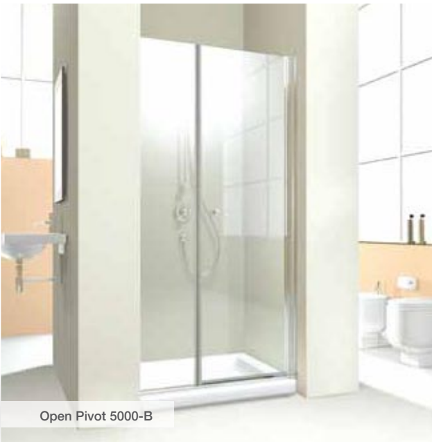
Open Pivot 5000-B